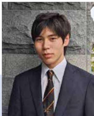
EY新日本有限責任監査法人 勤務