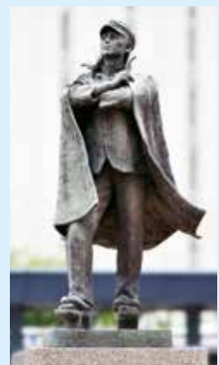
JR岡山駅前の六高学生像