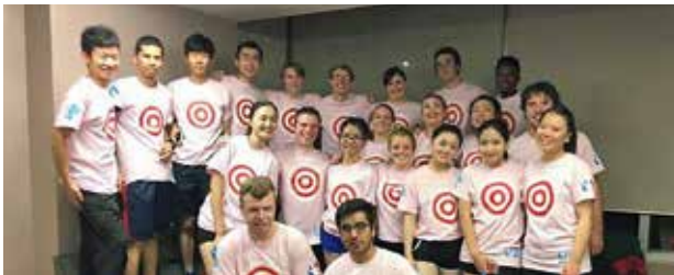
アルバータ大学（カナダ）

EPOKのほかにも、夏期、春期の長期休暇を利用した4～5週間の語学研修から、韓国や中国の大学で1年間学べるキャンパス・アジアプログラムまで、様々な大学の留学プログラムが利用できます。