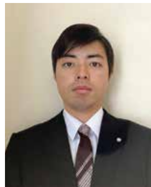
中国電力株式会社 勤務